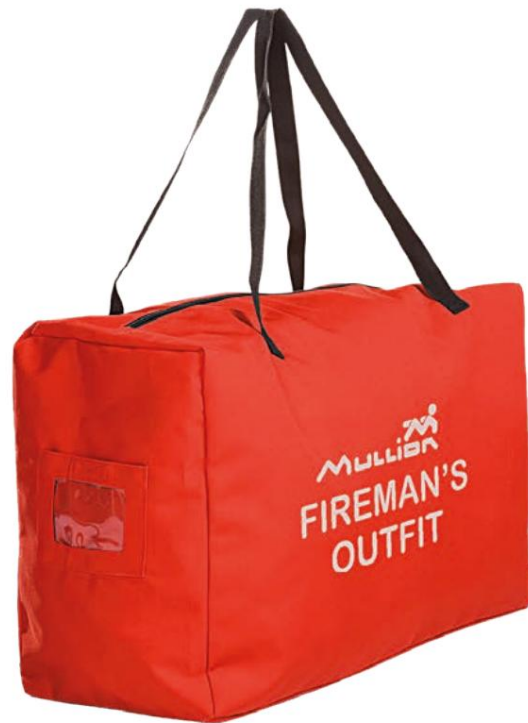
Bolsa de almacenamiento para bomberos