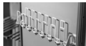
Perchas para guantes