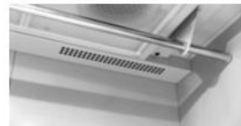
Palos para colgar

Un armario de secado no es un sustituto de una secadora, sino el compañero perfecto para satisfacer las demandas de los clientes más exigentes.