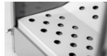
Estantes para zapatos